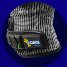
Sujeción con Velcro