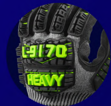
Protección 360° Antigolpes