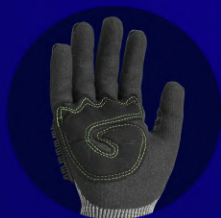
Guante 100% Anticortes